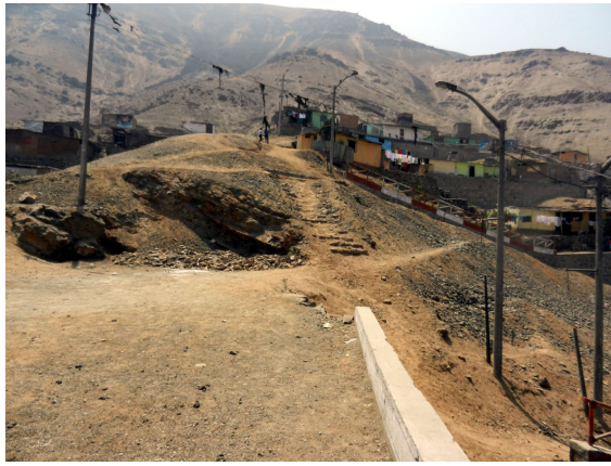
wegen in El Madrigal