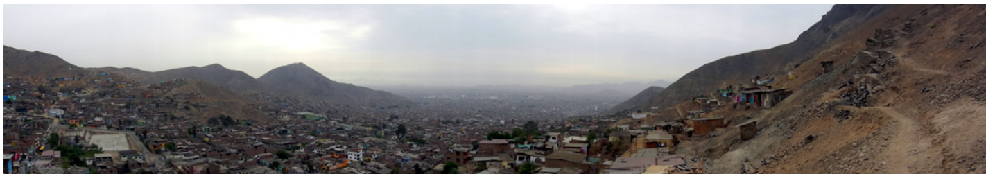
uitzicht op Lima vanaf el Madrigal