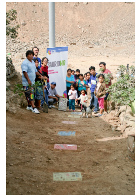
team en bewoners

Het uiteindelijke maken en plaatsen van de stenen gebeurt pas als we al weer terug zijn. De bewoners willen de mallen graag houden. Als er bij de volgende zelfbouw beton over is dan kunnen er meer gemaakt worden.