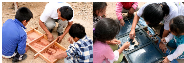
mallen en tegels maken